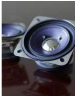
8cm フルレンジスピーカー