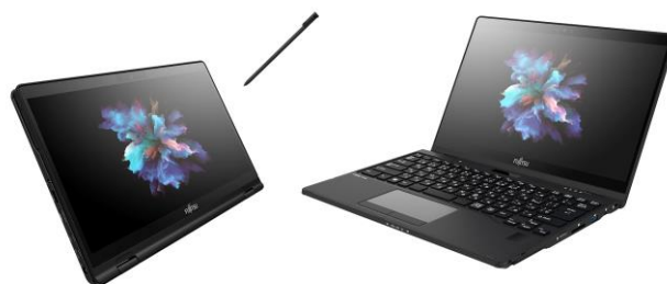
LIFEBOOK UH シリーズ

また、同時に発売される FMV LIFEBOOK UH シリーズは、ビジネスシーンでのモビリティを追求した軽量モデルで、移動先でのプレゼンなどでも活用できる高音質スピーカーが採用されています。