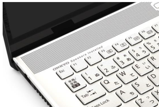
ONKYO Speaker Installed

FMV LIFEBOOK NH シリーズは、リビングでの利用に最適な 17.3 型の大画面液晶を搭載した PC です。HDMI 入力端子搭載によりセカンドディスプレイとしても利用でき、ゲーム機やスマートフォンを接続して画面を映写できます。大画面をより楽しんでいただくために、低域を強化した新規開発のスピーカーボックスが搭載されており、迫力のある低音を実現しています。また、音響補正アプリケーション「Dirac Audio」が搭載されており、スピーカーユニットに最適化された音楽、映画などコンテンツに応じた臨場感がお楽しみいただけるようになっています。