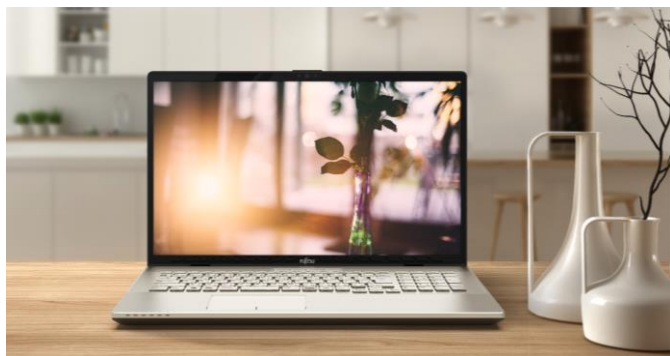
LIFEBOOK NH シリーズ

オンキヨー株式会社は、7月18日より順次発売される富士通クライアントコンピューティング株式会社（神奈川県川崎市、以下「FCCL」）の個人向けノートパソコン FMV「LIFEBOOK NH シリーズ」と「UH シリーズ」に、当社製スピーカーユニットが搭載されましたことをお知らせいたします。