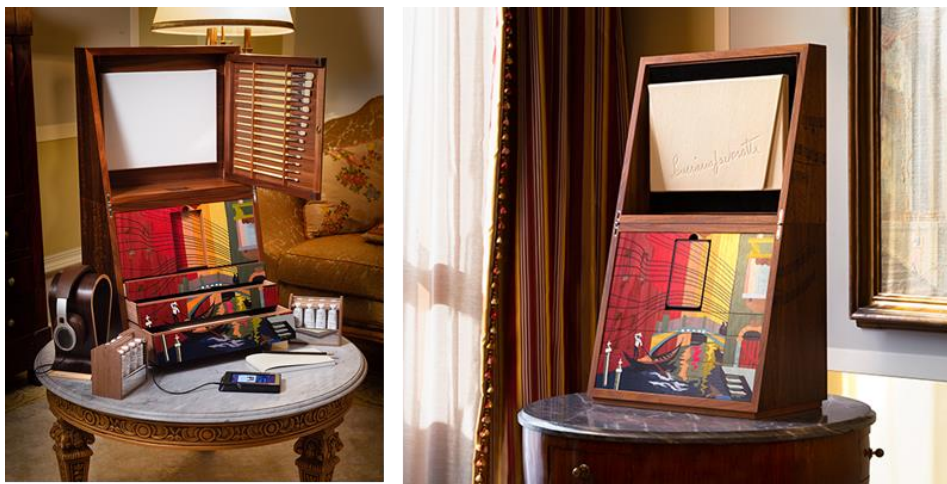
Luciano Pavarotti ‘Life in Art’

オンキヨー株式会社（大阪市）は、このたび、イギリスのレコード会社 Decca Records（ロンドン/イギリス。以下「Decca」）が、世界三大テノールの1人、ルチアーノ・パパロッチィの未発表音楽コンテンツが内蔵された ‘Life in Art’ を発表するにあたり、当社製ハイレゾ対応デジタルオーディオプレーヤーが採用されましたので、お知らせします。