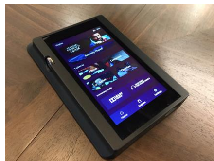
デジタルオーディオプレーヤー

また、あまり知られてはいませんが、パパロッチィは油絵や上質な家具や工芸にも情熱を持って取り組んでいました。ディスプレイケースには彼が手掛けた絵が木象嵌で再現されています。更に、購入者はパパロッチィ家への食事に招待される特典も付けられています。