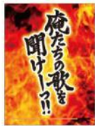
起動画面 XDP-20(L) 用

画面上のボタンをマクロス仕様にデザイン! さらに起動画面や終了画面もオリジナルデザインに!