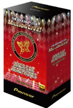
オリジナルパッケージ