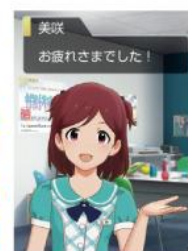
起動画面、終了画面も特別仕様