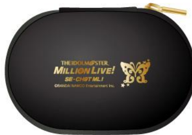
オリジナルイヤホンケース