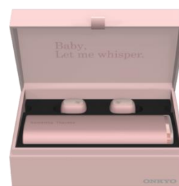
ジュエリーボックス風のパッケージ