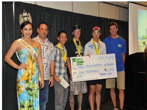
表彰式の