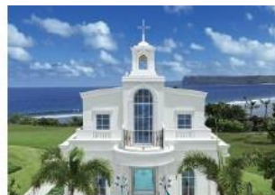
アクアステラチャペル