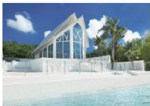
ジュエル・バイ・ザ・シー