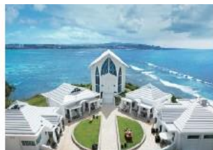
クリスタルチャペル