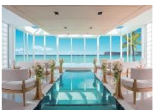
ルース・デ・アモール チャペル