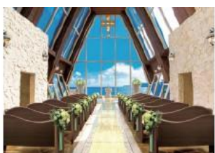
セント・プロバス・ホーリー・チャペル