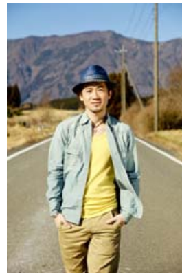
ナオト・インティライミ