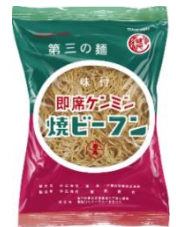
初代焼ビーフンパッケージ