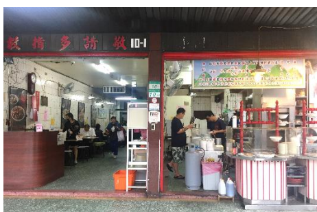
台湾屋台のイメージ

日本ではビーフンといえば「焼ビーフン」のイメージが強いですが、中国や台湾、東南アジアでは汁ビーフンとしても、よく食べられています。汁ビーフンはやさしい味の出汁と肉や野菜を一緒に煮込んだメニューで、屋台で食べる朝食としても親しまれています。