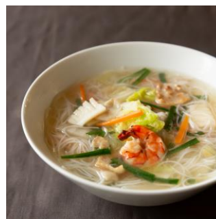
汁ビーフン調理イメージ

→汁ビーフンにすると、お出汁の風味と馴染むしなやかな食感をお楽しみいただけます。