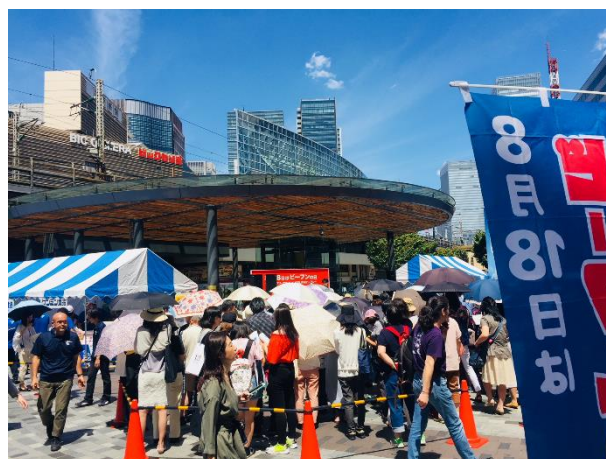
昨年の東京での焼ビーフン無料配布イベントの様子