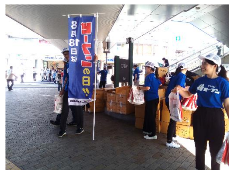
昨年の神戸での焼ビーフン無料配布イベントの様子