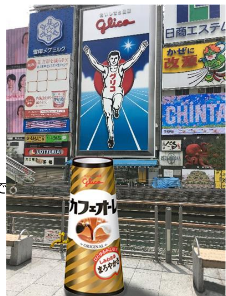
巨大カフェオーレ蛇口 イメージ

暑い日が続き、すぐに疲れてしまいがちな季節ですね。そんな時、カフェオーレが蛇口から出てきたら、疲れたココロとカラダに染みわたって、ちょっとだけ元気になれるのでは…という想いから、全長2メートルの巨大カフェオーレ蛇口を、道頓堀グリコサインとコラボするかたちで実現！蛇口の諸先輩方の貴重なアドバイスを元に、素敵なひとときをお届けします。ぜひ道頓堀グリコサインまでお運びいただき、ちょっとひとゆるみして、お買い物や旅行をさらにたのしんでくださいね。