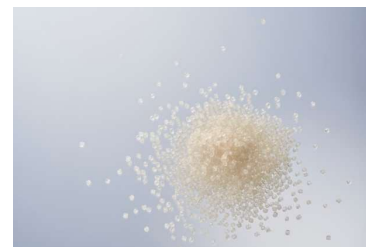
軽量化を実現した高品質素材 PPSU

モデルごとの設計に合わせて、医療機器にも用いられるPPSUやβチタンなど、軽さ・柔軟性・耐久性に優れた高品質素材を採用。最適な素材を使い分けることで、かけていることを忘れるほどの細いフレームや、頭にしっかりフィットするフレームなど、どのデザインでも快適な装着感が得られるよう工夫しました。