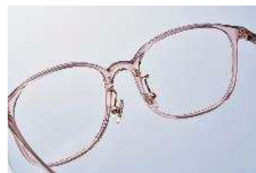
シリコン製の鼻パッドを採用することでより滑りにくく