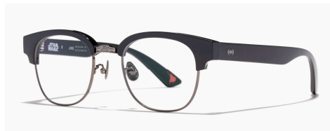
ダース・ベイダーモデル