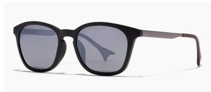
【大人向け】マンダロリアンモデル