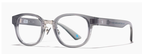
ルーク・スカイウォーカーモデル