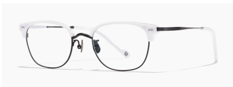
ストームトルーパーモデル