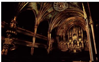
SUPERREAL(チプリアーニ ニューヨーク)

https://momentfactory.com/work/all/all/aura