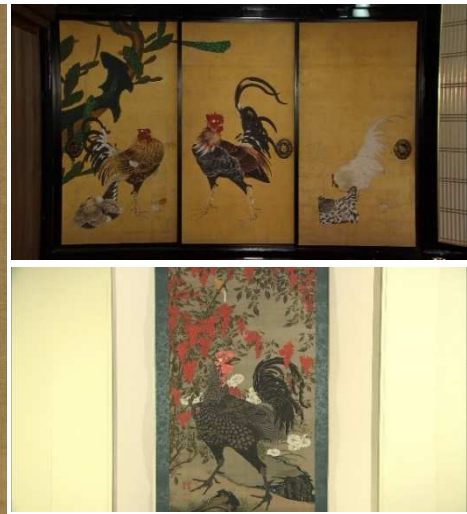
(上)仙人掌群鶏図 (下)動植綵絵

美術・アートな作品(絵画や彫像、工芸品、建築物)や作者等にスポットを当て、そこに秘められたドラマや謎を探る美術エンターテインメント番組「KIRIN ART GALLERY 『美の巨人たち』」。