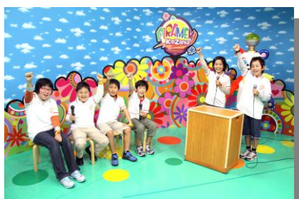
キッズニア東京「ピラメキッズニア」 制作の様子

来る7月7日、テレビ東京のキャラクター“ナナナ”は初めての誕生日を迎えます。 それに合わせ、テレビ東京は「キッズニア東京」(江東区豊洲)にオフィシャルスポンサーとして出展している テレビ局パビリオンのアクティビティをリニューアルし、新コーナー「ナナナのナナナたいそう」をスタートします。