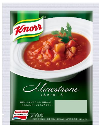
「クノール®」 ミネストローネ