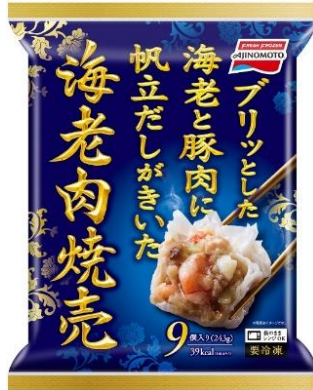
「海老肉焼売」 (新製品)

「海老肉焼売」は、上品なやさしい味わいかつ食べ応えもある肉焼売であることから、現在ご好評いただいている「ザ★®シュウマイ」とは異なり、シニア世帯が求めるくあっさりとした上品な味わいの肉焼売というニーズにもお応えできる製品です。くもう1品メニューを足して、もう少し食卓を充実させたいというオケーションやニーズは、世代や家族構成、シーンによって多様であることから、当社は「ザ★®シュウマイ」に加えて、「海老肉焼売」という新たな王道の肉焼売を発売し、焼売のラインナップを強化します。食卓の強い味方である冷凍焼売を、日々の食事スタイルや気分に合わせて使い分けいただくことで、彩りのある充実した食卓をサポートします。