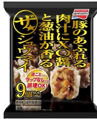
「ザ★®シュウマイ」 (既存品)