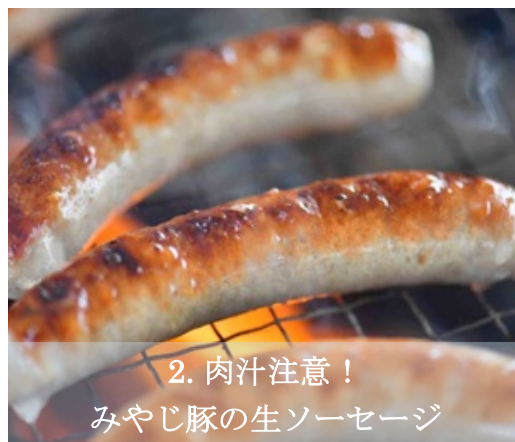
2. 肉汁注意！ みやじ豚の生ソーセージ

雑味なし。野菜本来のうまさ、甘み。「野菜嫌いな子どもでもバクバク食べられる」という評判を頂いているこだわり野菜です。