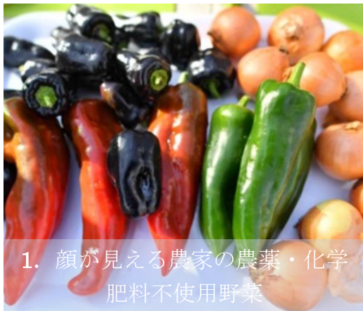
1. 顔が見える農家の農薬・化学肥料不使用野菜

雑味なし。野菜本来のうまさ、甘み。「野菜嫌いな子どもでもバクバク食べられる」という評判を頂いているこだわり野菜です。