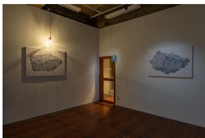
《未発見の小惑星観測所_3331 Arts Chiyoda》