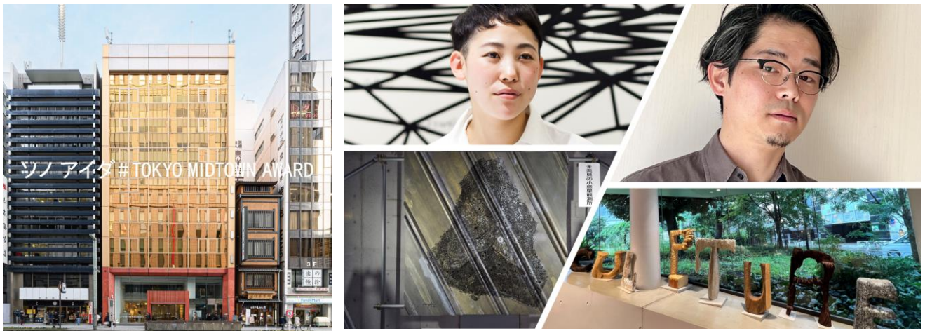
▲「ソノ アイダ # TOKYO MIDTOWN AWARD」 日本橋室町162ビル外観