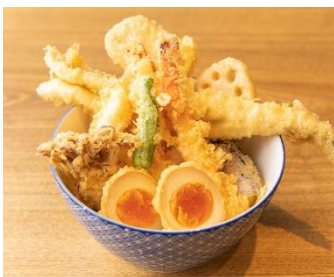
特上天寅丼 天ぷら 天寅(2F)