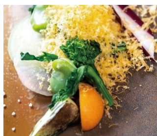
新春シェフスペシャルメニュー RESTAURANT TOYO (3F)