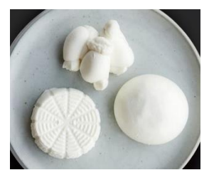
つくりたてチーズ3種セット GOOD CHEESE GOOD PIZZA (2F)