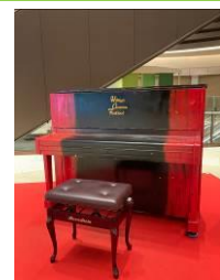
STREET PIANO!!! in Hibiya 東京ミッドタウン日比谷 アトリウム(1F)