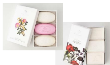
アッカカッパ ソープ ギフトセット ACCA KAPPA (1F)