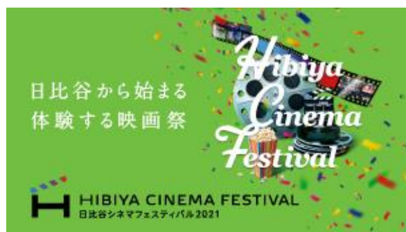
HIBIYA CINEMA FESTIVAL 2021 メインビジュアル

協力：株式会社コトブキ／TOHO シネマズ株式会社／ トロント日系文化会館／株式会社キネマ旬報社