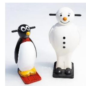
▲そりのレンタルも人気