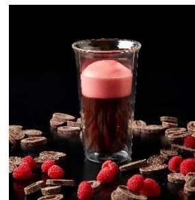
▲カフェチケットメニュー例 ザ・リッツ・カールトン カフェ&デリ (ホットチョコレート ラズベリーエスプーマ)