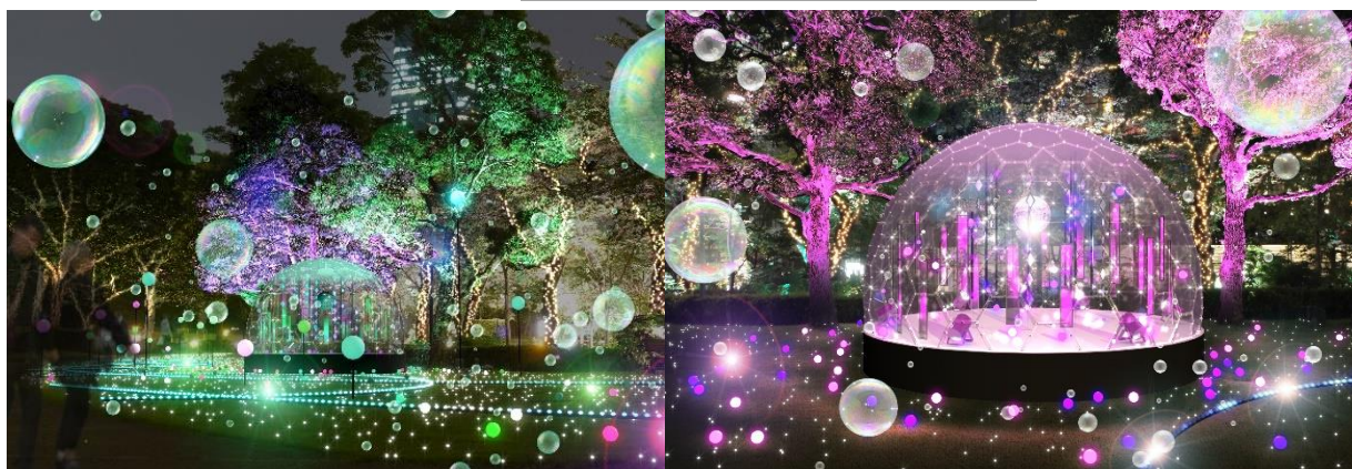
▲しゃぼん玉演出のイメージ