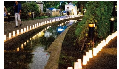
▲過去のミッドタウン・ガーデンの様子