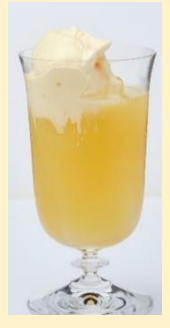
クリームシールド ¥1,870(チャージ別途)▶ (STAR BAR)