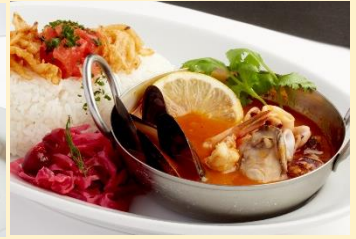
シーフードカレー ¥1,320 (BOSTON OYSTER & CRAB)