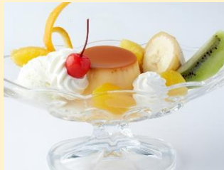
プリンアラモード ¥1,100 (一角)