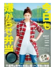
今日も 嫌がらせ弁当