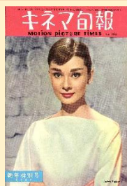
オードリー・ヘプバーン (1957年)