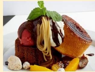
マロンオランジュ ¥1,230 (Patisserie & Café DEL'IMMO)