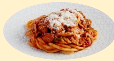
▲ナポリタン焼きうどん ¥1,070 (NADABAN by HAL YAMASHITA)