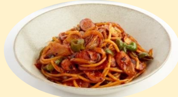
▲ナポリタン ¥990 (Värmen)