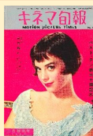
ナタリー・ウッド (1957年)