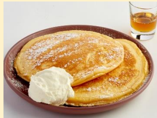
バターミルクパンケーキ ¥1,100 (THE SPINDLE)