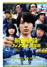
前田建設 ファンタジー営業部