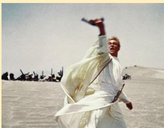
アラビアのロレンス

大型スクリーンで今こそ見たい名作の数々 オトウールからヘップバーンまで往年のスターが蘇る 「アラビアのロレンス」「ローマの休日」「第三の男」「美女と野獣」「麗しのサブリナ」「喝采」※全 6 作品