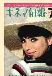
アンナ・カリーナ (1966年)