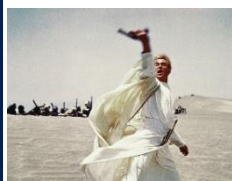
アラビアのロレンス

“日比谷映画劇場”リバイバル 閉館から35年！日比谷映画劇場 おかえりなさい上映会