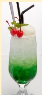
メロンクリームソーダ ¥850 (DRAWING HOUSE OF HIBIYA)