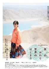
旅のおわり 世界のはじまり