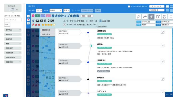
▲顧客対応履歴を細かに記録。提出資料も添付できる。

顧客の状態を分類し見分けることができます。またアプローチの遅れや放置している案件に対して、2日ごとに自動で通知をするアラート機能がついているため、営業状況や進捗・履歴を細かく管理でき、営業担当だけでなく、管理職も瞬時に営業状況を把握できます。