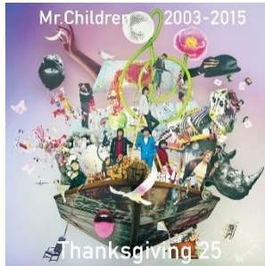
▲25th Anniversary 配信限定ベストアルバム

Mr.Children公式サイト http://www.mrchildren.jp/