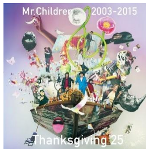
▲25th Anniversary 配信限定ベストアルバム

Mr.Children公式サイト http://www.mrchildren.jp/