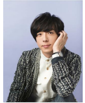
(C)須田卓馬 ※使用の際は上記のクレジットを いれていただくようお願いいたします。

10月から放送のフジテレビ月9、NHK連続テレビ小説「わろてんか」への出演が決まっている。今後、公開待機作品に映画「THE LIMIT OF SLEEPING BEAUTY」、「blank13」、「嘘を愛する女」、「空飛ぶタイヤ」などがある。