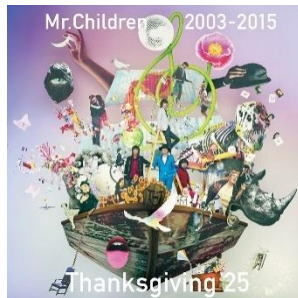
▲25th Anniversary 配信限定ベストアルバム

Mr.Children公式サイト http://www.mrchildren.jp/