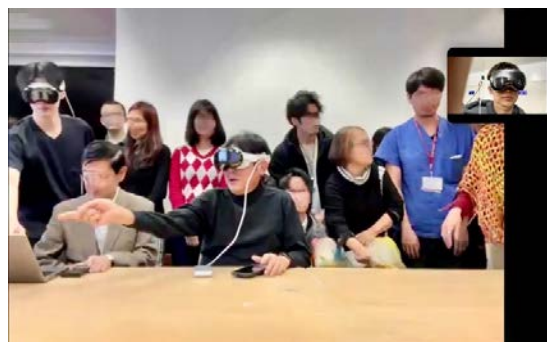
Apple Vision Pro と Vision OS アプリ「Holoeyes Body」を用いた医療遠隔カンファレンスの様子