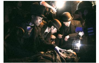
SHERLOCK HOLMES, DR. WATSON, and are trademarks of Conan Doyle Estate Ltd.® 「ザ・シャーロック ジェームズ・モリアーティの逆襲」

【 https://ec.travel.jr-central.co.jp/tp/optionalFacilities/4012M07/plans?lang=ja 】