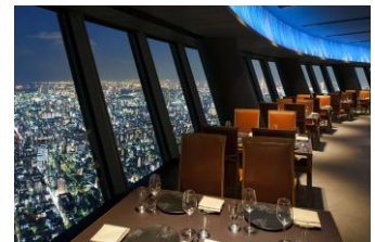
Sky Restaurant 634

※キャンペーン概要や応募要項等は公式X「東京ゾクゾク【JR東海公式】 ( https://x.com/tokyo_zokuzoku )」でご確認ください。