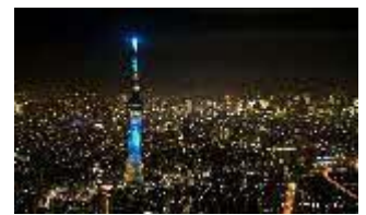
東京スカイツリー

【 https://ec.travel.jr-central.co.jp/tp/optionalFacilities/4018H07/plans?lang=ja 】