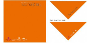
E X 旅先予約購入者 限定デザインのバンダナ