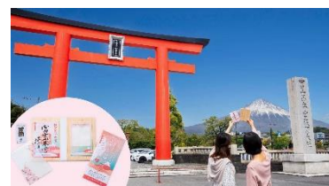
富士山本宮浅間大社と美々咲良祈願

【設定日】2024年10月1日(火)～ ※12月29日(日)～1月3日(金)を除く