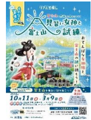
「見習い女神と富士山の試練」 チラシイメージ