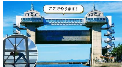
沼津港大型展望水門「びゅうお」