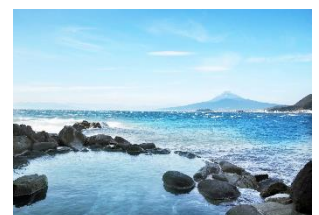
淡島ホテル 露天風呂