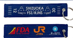
(上) 特別フライト遊覧