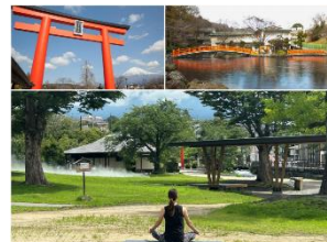
富士山本宮浅間大社