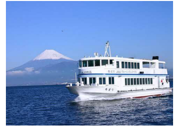
沼津港遊覧クルーズ