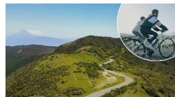
西伊豆スカイライン