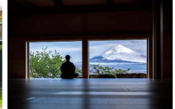
御殿場高原時之栖 禅堂