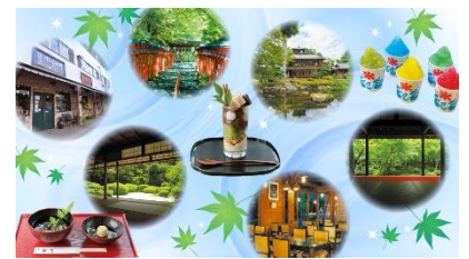
京都 癒し旅チケット