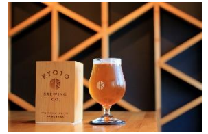
「京都醸造」クラフトビール

東寺の南に工場を構える、京都発のクラフトビール。工場内で出来たて定番ビールと季節限定ビール 2 種を飲み比べできる特別プランです。①お試しサイズの S サイズ (200ml) × 2 種と②ビール好きのための L サイズ (400ml) × 2 種のプランをご用意しました。