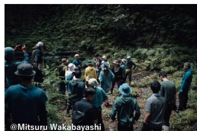
貴船の杜づくり協議会の取り組み