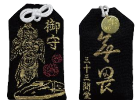
三十三間堂 30周年限定御守り