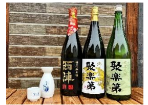
佐々木酒造 日本酒飲み比べ試飲プラン

常時 15 種類以上の日本酒からお好みに合わせて 6 種類試飲して頂けるプランです。佐々木酒造の酒蔵でしか飲めないレア酒も登場するかも!? お土産にぴったりの EX オリジナルカラーの手ぬぐい付き。