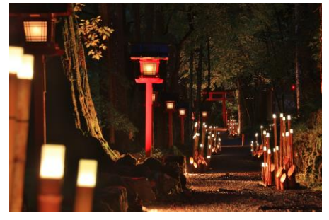
ひかりの京都 in 貴船神社

「そうだ 京都、行こう。」キャンペーンでは「京都がくれる癒し」をテーマに様々な特別プランを実施しています。 【癒しプラン紹介】