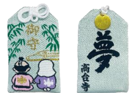
高台寺 30周年限定御守り