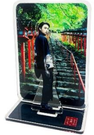
限定アクリルスタンド