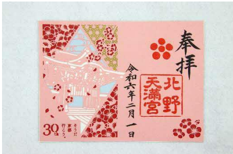
切り絵御朱印イメージ