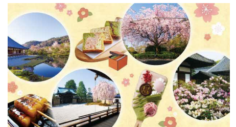
寺院・スイーツ イメージ

※対象寺院で使用できるチケット1枚・対象寺院 or スイーツ店舗 どちらかで使用できるチケット2枚付きです。