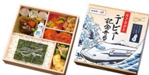
N700Sデビュー記念弁当・パッケージ