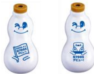
しょう油入れ「ひょうちゃん」デザイン