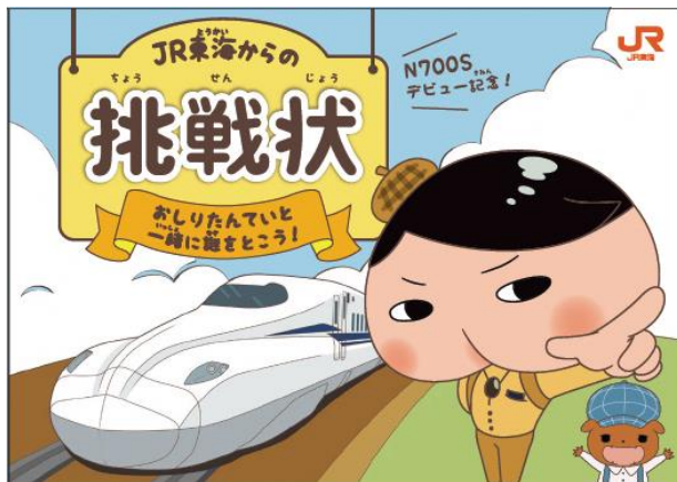
(オリジナルブック・表紙等)

「JR東海からの挑戦状」を手にしたあなたを「なぞとき旅」にご招待！ おしりたんていが「N700S」に隠された謎をププッと解決？！