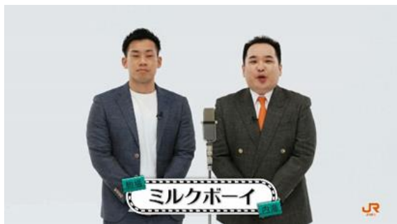
(オリジナル漫才・一部シーン)

「うちのオカンがね、好きな乗り物があるらしいんやけど。」 オカンが忘れてしまった乗り物とはいったい何なのか…。