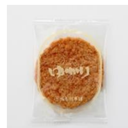
坂角総本舗「ゆかり」