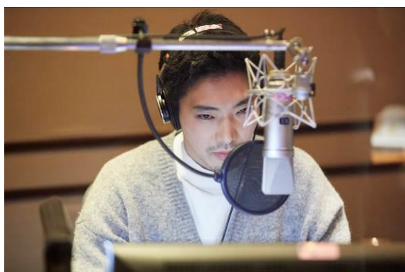
ナレーション収録中

YouTube公式チャンネル： https://www.youtube.com/channel/UCP40QiZo7EjfltE3QkStkCw