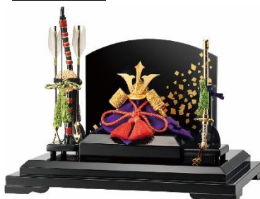
1位:純金兜「剣鍔形」 税込価格:680,000円

現代のインテリアにもマッチする小型の純金製兜が金部門の1位に。例年、コンパクトでありながら高い資産性を備えた純金製の兜の人気が上昇しています。