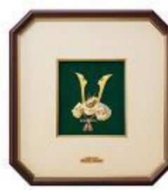
1位:純銀額「兜」 税込価格:43,000円

華やかな彩色仕上げが美しい兜をモチーフにした飾り額は、省スペースで節句のお祝いができることや、お求めやすい価格も人気のポイントです。