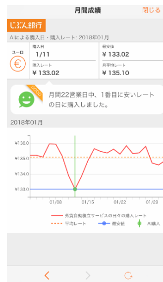
< 月間成績詳細 >