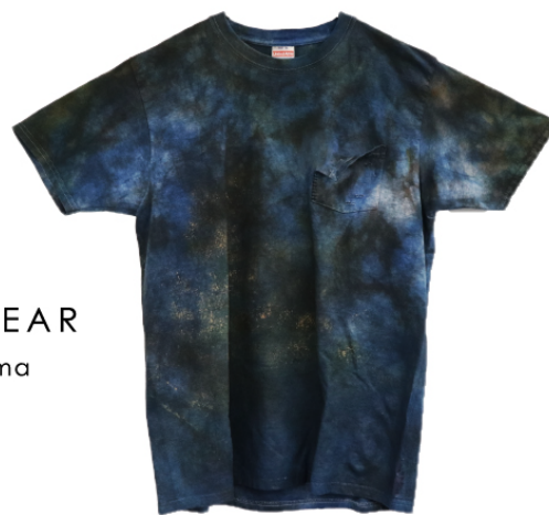
泥染 + 藍染