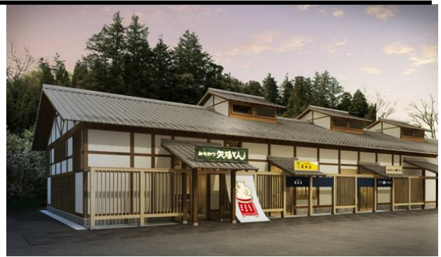
（左）矢場とん 大阪 阪急三番街店 （右）矢場とん 名古屋城 金シャチ横丁店 ※画像はパース画像です