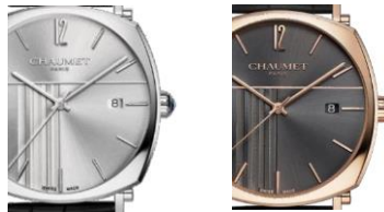
左: サンレイ セテン仕上げのライトグレー ガルバニック 右: サンレイ セテン仕上げのチャコールグレー ガルバニック

※『ル レジャン』ダイヤモンドとは、ナポレオンの刀(摂政刀)に施されていたクッションカットの最も大きなダイヤモンドのことで、