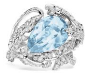
(083944) WG、ダイヤモンド、アクアマリン 7,000,000～ 8,000,000円台