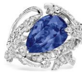
(083943) WG、ダイヤモンド、タンザナイト 7,000,000～ 8,000,000円台