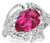
(083942) WG、ダイヤモンド、 ピンクトルマリン 7,500,000円台