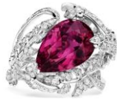
(083939) WG、ダイヤモンド、 ロードライトガーネット 7,500,000円台