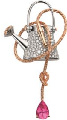
ピエール ドー (084077)

ホワイトゴールド・ピンクゴールド ダイヤモンド・ピンクトルマリン 3,280,000円