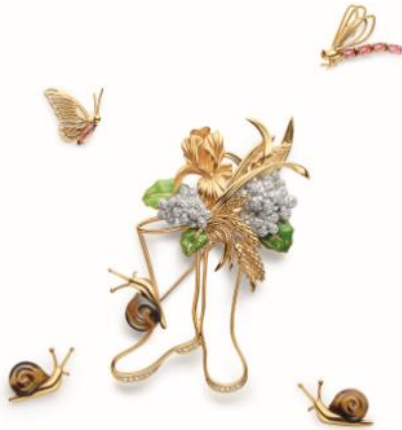
ソナート オートヌ (083966)

イエローゴールド・ダイヤモンド ロードライトガーネット・タイガーアイ グリーンラッカー 4,270,000円