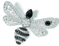
(084446) WG、ダイヤモンド、ブラックスピネル 2,210,000円