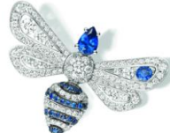
(084447) WG、ダイヤモンド、サファイア 2,210,000円