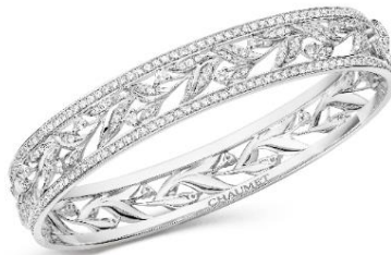
「ローリエ」コレクション ブレスレット WG.ダイヤモンド ¥4,820,000(税抜) (084314)