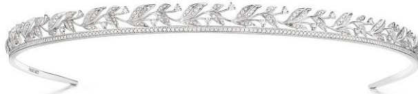
「ローリエ」コレクション ヘッドバンド WG.ダイヤモンド ¥5,240,000(税抜) (084319)

ローリエの葉のモチーフを横に細く繋げ、モダンで繊細なデザインです。 葉の部分には2種類のブリリアントカット ダイヤモンドをセットし、生き生きと躍動感のある仕上がりに。 3つの爪でセットされたダイヤモンドが配され、更なるきらめきを加えています。 丁寧に磨き上げられたホワイトゴールドとダイヤモンドパヴェのコントラストが美しいハーモニーを奏でる ヘッドバンドとブレスレットです。