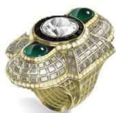
(084153-053) オリアンリング ★ ★ イエローゴールド ロッククリスタル カボションカット エメラルド 1.35 ct, 1.25ct ラウンドブリリアントカット ダイヤモンド ¥36,400,000

ホワイトサファイアのブルズアイの窓、ゴールドの手すりや、ラッカー仕上げのルーフで、「イザドラ」リングはパリの建築物を優雅に、かつ軽やかに解釈しています。頂上には、マダガスカル産のサファイアやコロンビア産のエメラルドといった希少なプレシャストーンをあしらっています。