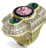
(084155-051) オリアンリング ★ ピンクゴールド ロッククリスタル カボションカット エメラルド 1.37ct, 1.33ct ラウンドブリリアントカット ダイヤモンド ヴィヴィッドピンク サファイア 2.67ct ¥28,700,000