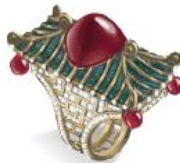
(084145-054) レディ ウェイリング ★ ピンクゴールド バゲットカット インディコライトトルマリン ルベライト ラウンドブリリアントカット ダイヤモンド シュガーローフ ルベライト 8.70ct ¥22,900,000