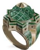
(084137-054) シェエラザード リング ★ ピンクゴールド ラッカー ラウンドエメラルド カボションカット マラカイト ¥9,970,000