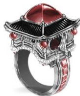
(084148-053) マダム バタフライ リング ★ ★ ピンクゴールド オニキス ロードライト ガーネット ラウンドブリリアントカット ダイヤモンド シュガーローフ マラヤガーネット 8.34ct ¥18,800,000