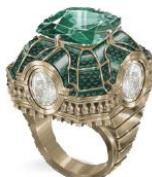
(084157-053) イザドラリング ★ イエローゴールド ラッカー オーバルカット ホワイトサファイア クッションカット エメラルド 5.10ct ¥34,000,000

★★マークの作品は画像のご用意がございます。 ☆☆マークの作品は中にコンパートメントがございます。 *価格は2020年1月現在の価格です。 *ご掲載は2020年2月25日以降でお願いいたします。