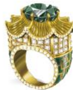
(084143-053) キアンロンリング ★ イエローゴールド ラッカー ラウンドブリリアントカット ダイヤモンド オーバルカット グリーントルマリン 7.20ct ¥15,800,000