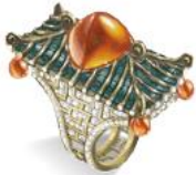
(084144-053) レディ ウェイリング ★ イエローゴールド バゲットカット インディコライトトルマリン マンダリンガーネット ラウンドブリリアントカット ダイヤモンド シュガーローフ マンダリンガーネット 8.62ct ¥26,400,000