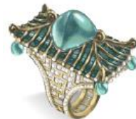
(084146-052) レディ ウェイリング ★ イエローゴールド バゲットカット インディコライトトルマリン グリーントルマリン ラウンドブリリアントカット ダイヤモンド シュガーローフ グリーントルマリン 8.80ct ¥22,900,000

★★マークの作品は画像のご留意がございます。 *価格は2020年3月現在の価格です。