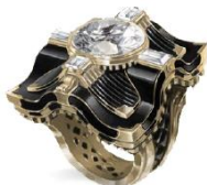
(084151-052) サクラ リング ★ ピンクゴールド ブラック ジェイド ラッカー バゲットカット ダイヤモンド ラウンドブリリアントカット ダイヤモンド 2.08ct ¥36,400,000

「マダム バタフライ」リングは、「蝶々夫人」のオペラ戯曲からインスパイアされ、マラヤガーネットの情熱的な赤が印象的です。オニキスのパゴダ(仏塔)の中を覗いてみると、煌びやかなゴールドや謎めいたブラックラッカーによって、細かいオープンワークの陰影が浮かび上がってきます。