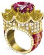
(084141-052) キアンロンリング ★ ピンクゴールド ラッカー ラウンドブリリアントカット ダイヤモンド オーバルカット ピンクトルマリン 7.89ct ¥15,800,000

メゾン受け継ぐ美しいラインと造りを生み出す優れた技術を追求し、「レディ ウェイ」リングは指の上で繊細な存在感を放つリングになりました。ゴールドとインディコライトトルマリンで表現した幾何学的なパゴダ(仏塔)に、マンダリンガーネットやルベライトのビーズが施されています。