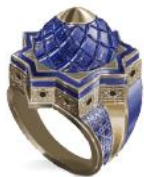
(084135-052) シェエラザード リング ★ イエローゴールド ラッカー ラウンドサファイア カボションカット ラピスラズリ ¥9,970,000

ラピスラズリのドームと星が瞬く東の空からインスパイアされた「シェエラザード」リングは、マラカイトのバージョンも取り揃えました。ファセットで仕上げたドームからプレシャスストーンのセッティングで表現した星のモチーフまで、このクリエイションはあらゆるディテールで建築物の美しさを讃えています。