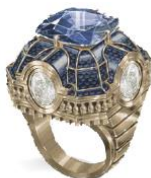
(084156-052) イザドラリング ★ ホワイトゴールド ラッカー オーバルカット ホワイトサファイア クッションカット サファイア 6.51ct ¥34,000,000