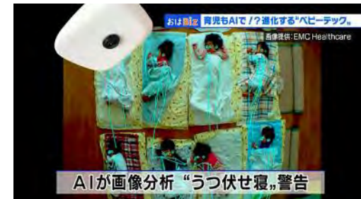
▲ NHK おはよう日本 おはBiz（全国放送）