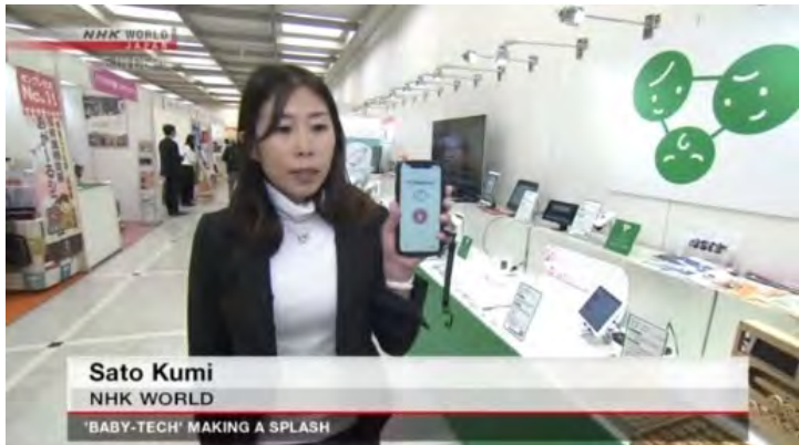
▲ NHK WORLD（国際放送）