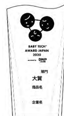
▲ 2020年大賞トロフィー （イメージ）