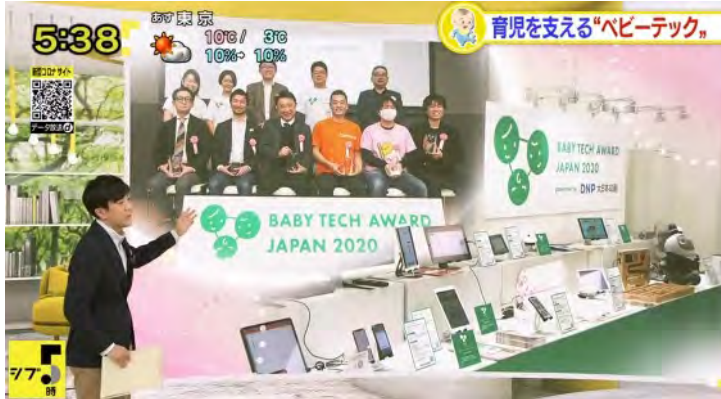
▲ NHK シブ5時（全国報道）