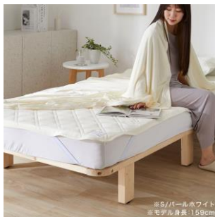
※S/ダブルホワイト ※モデル身長:159cm