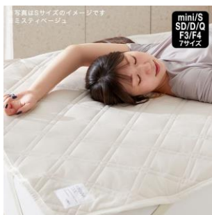
mini/S SD/D/Q F3/F4 7サイズ