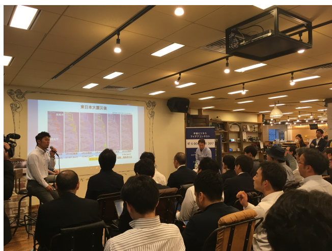
2017年6月1日「S-Booster 2017」が公表された。

近年、世界では宇宙関連のビジネスが盛り上がりを見せる中、日本でも昨年5月に内閣府が「宇宙産業ビジョン2030」を取りまとめるなど宇宙のビジネス化が注目を集めている。