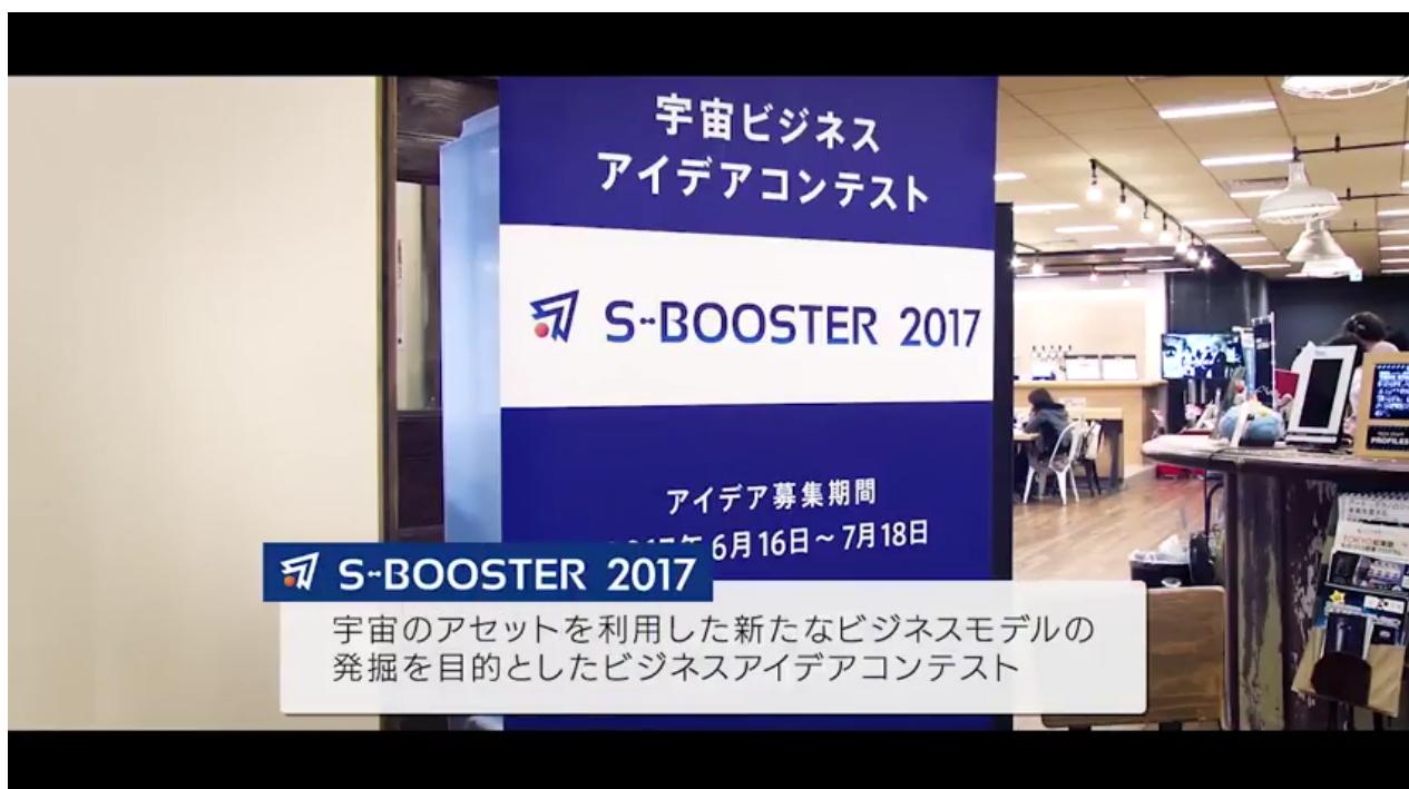
「S-booster 2017」イベント動画が完成！

多くの反響と関心を得た「S-Booster 2017」。その全貌を振り返る特別動画が公開された。