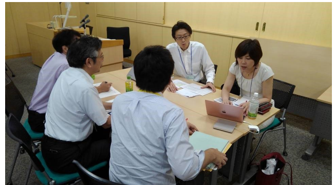
ファイナリストたちにとって刺激のある合宿となった。

最終選抜会ではファイナリストのプレゼンテーションを「実現性」「収益性」「革新性」「発展性」の4つの観点から審査したが、これらの要素を盛り込んだビジネスプランの作成やプレゼンテーションは経験を積んでいない者には至難の業である。そこで行われたのがメンタリング合宿。