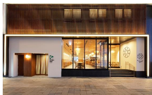
狸小路商店街側エントランス