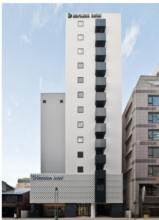
からくさホテル札幌 外観

昨年7月より先行予約を開始。開業日から2018年6月30日(土)までの期間は、 公式ウェブサイト限定で「開業記念 スマホレンズ付き特別宿泊プラン」を販売中 です。スマホレンズは泊数に関わらずお一人様1個プレゼント。期間・料金等詳細は4ページ目をご参照ください。