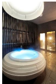
左: 脱衣所(女性)、右: 露天風呂(女性)