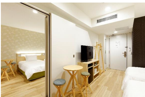
コネクティングルーム(4名様用)