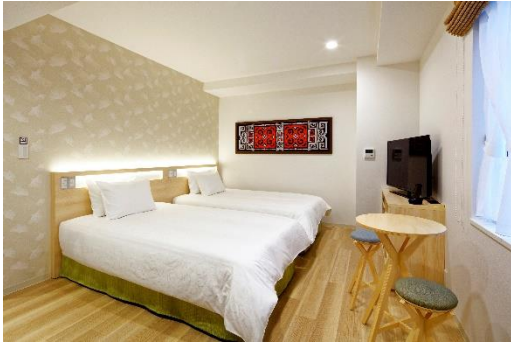
スタンダード/ハイフロアツイン 21.5㎡~21.9㎡

客室は、ツイン 99 室、ツイン with Extra Bed 55 室、ダブル 11 室、和室 11 室、アクセシブルーム 1 室からなる全 11 タイプ・177 室。うち 110 室は最大 6 名様までのグループもしくはファミリー利用に最適なコネクティングルームとしてお使いいただけます。ダブル、アクセシブルームを除き、シャワーブース・洗面所・トイレを独立させるなど、複数人でも快適に過ごせる機能性に富んだレイアウトになっています。※スタンダードフロア(3~9階)とハイフロア(10~13階)のレイアウトは同じですが備品が異なります。客室一覧は 4 ページ目以降のホテル概要をご参照ください。