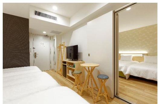
コネクティングルーム(6名様用)