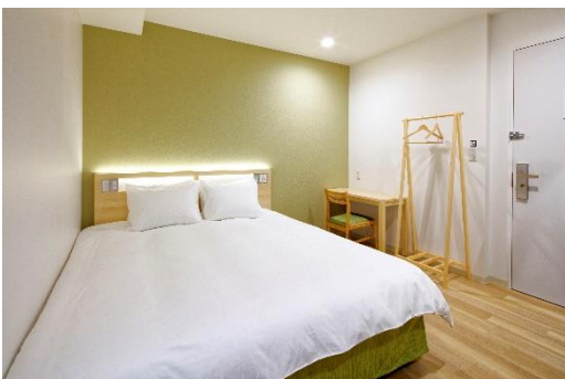
スタンダード/ハイフロアダブル 16.0㎡