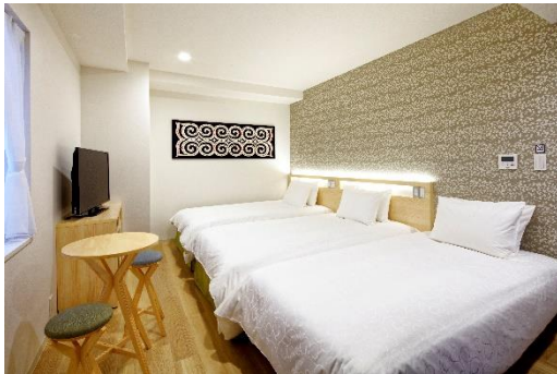
(ハイフロア) スーペリアツイン with Extra Bed 25.0㎡