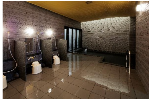
大浴場「からくさの湯」(男性)