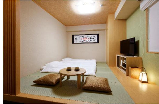
(ハイフロア) ジャパニーズファミリールーム 25.0㎡