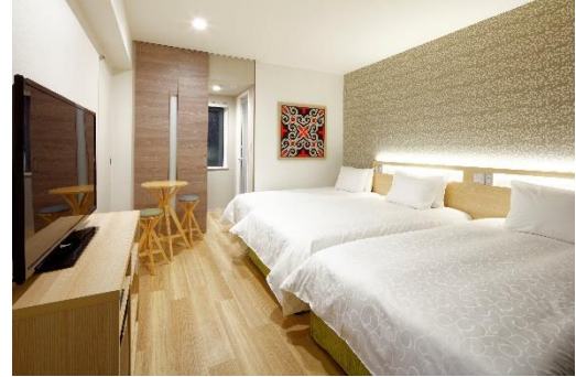
スタンダード/ハイフロアツイン with Extra Bed 21.5㎡